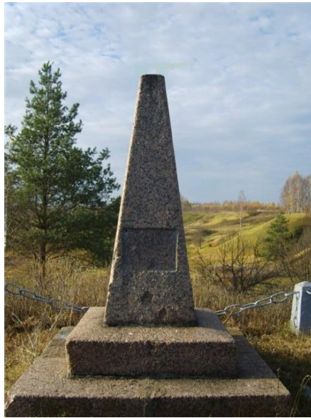
Вид памятника в начале девяностых.

Казачи станицы «подняли тревогу», стали стучаться в различные инстанции, добрались до Отдела культуры Смоленской области, чиновники которого разъяснили, что памятник лишили государственной охраны и сняли с баланса, потому что этого памятника просто «не существует». Тем не менее казаки станицы добились разрешения произвести реставрацию, с условием не затрагивать основных конструктивных элементов памятника. Казаками было принято решения дать «третью жизнь» казачьему обелиску за свой счёт, также было принято решение из-за мародеров не изготавливать орла и табличку из бронзы. Табличку изначально сделали деревянную, затем заменили на гранитную, вместо орла временно установили православный крест. В этот же период и сформировалась традиция казаков станицы обязательного посещения памятника в начале августа (дата сражения у Иньково по новому стилю - 8 августа), в том числе для уборки, покосу травы и выполнения необходимых текущих косметических и ремонтных работ.