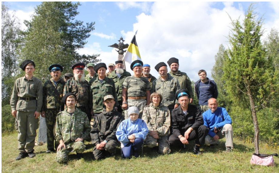
Казачи станицы «Смоленская» у памятника.

Всем, здравия, мира и добра! Храни нас Господь! Слава тебе господи, что мы казаки!