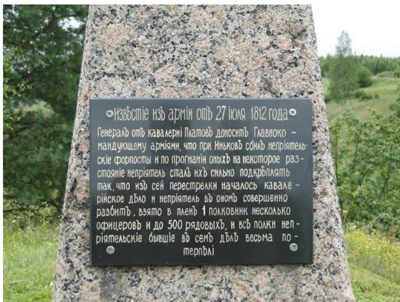
Памятная табличка на обелиске после реставрации.