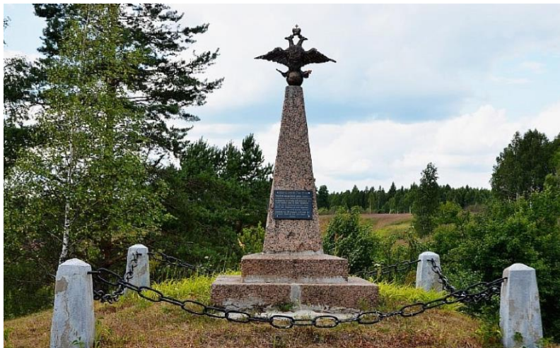
Современный вид памятника (координаты 54.978333, 31.365444).

Много времени и сил потратили казаки станицы на хождение по разным инстанциям, на утверждение и согласование восстановительных работ, на возвращение памятника в реестр объектов культурного наследия. Постановка памятника на учет состоялась 09.10.2015 года, а 01.03.2017 года памятник был зарегистрирован в «Перечне объектов культурного наследия (памятников истории и культуры) народов Российской Федерации федерального значения, расположенных на территории Смоленской области, включенных в единый государственный реестр объектов культурного наследия (памятников истории и культуры) народов Российской Федерации».