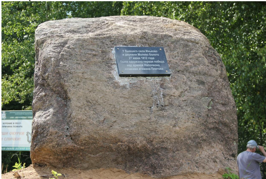
Общий вид памятного камня (знака).

Для того чтобы больше людей узнало о сражении у Иньково, о подвиге казаков, могли найти и посетить памятник на шоссе 66К-11, около поворота на Лоино (координаты 55.051816; 31.573720) казаками станицы был установлен памятный камень (знак), на котором были размещены две информационные таблички о сражении у Иньково, и том что памятный знак установлен жителями деревни Лоино и казаками станицы «Смоленская».