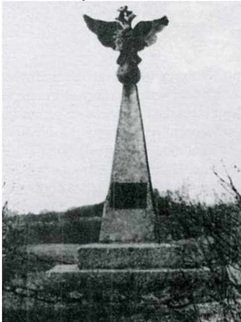
Вид памятника в 80-е годы.

В 1974 году постановлением Совета Министров РСФСР памятник был включён в реестр федерального имущества и взят под государственную охрану.