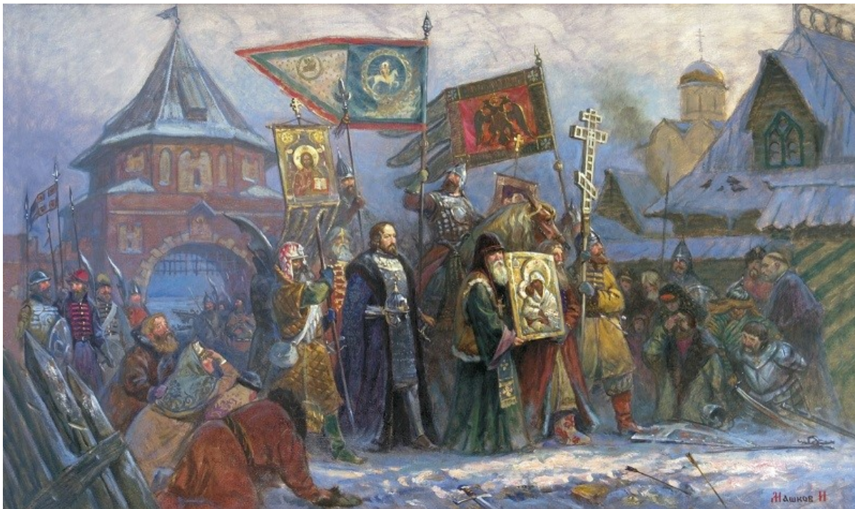
Великий вход Иоанна Грозного в освобожденный Полоцк (1563).