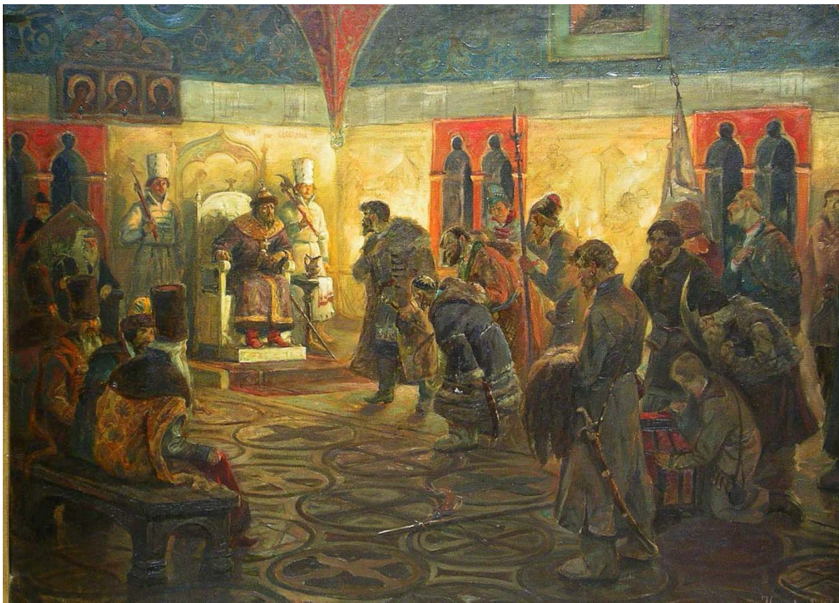
Посольство Ермака к Ивану Грозному.

«Традицию» отрицательной оценки личности Ивана Грозного, как мы уже отмечали, заложил изменник Курбский, которая, старательно поддерживается в общественном сознании. Но в таком случае, почему наши церковные иерархи и ныне всё ещё остаются заодно с Курбским?.. Это ведь не шуточный вопрос, ответ на который должен быть дан обязательно.